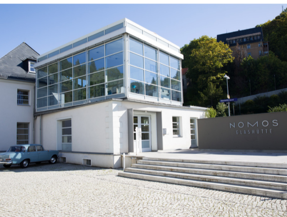
Nächster Halt: NOMOS Glashütte. Die Firmenzentrale im ehemaligen Bahnhofsbau.