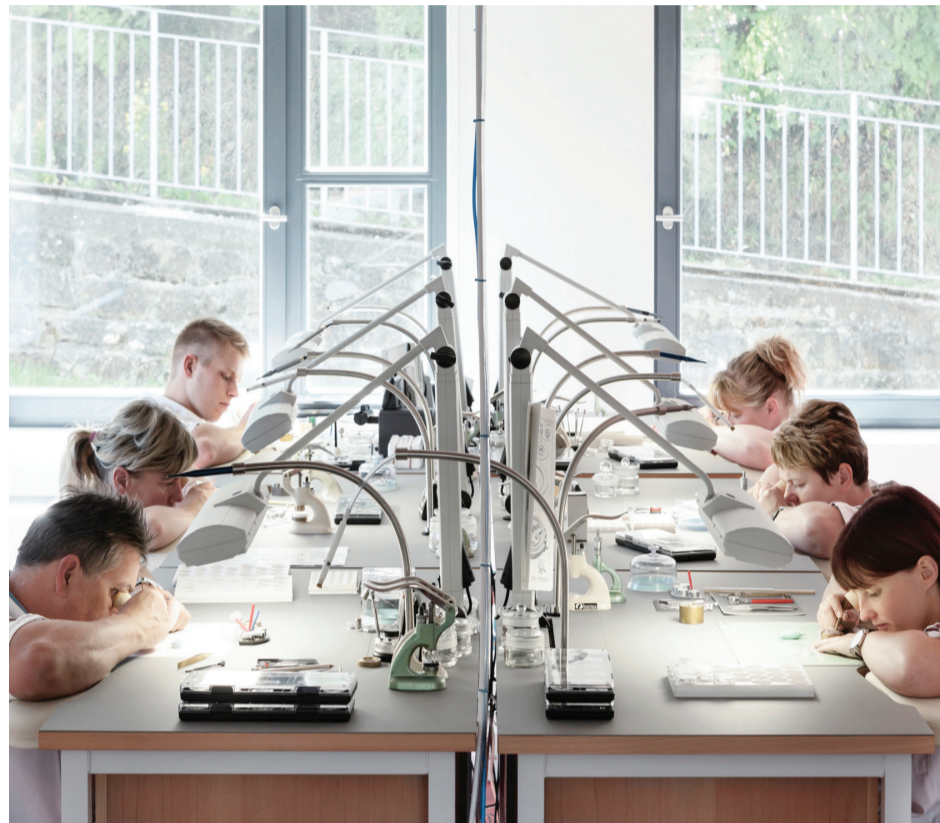
View into the chronometry at the Erbenhang (right). A steady hand is required.

Zahlreiche Einzelteile werden von Hand in der NOMOS-Chronometrie zu einem Uhrwerk zusammengefügt. Dies erfordert viel Erfahrung und nimmt viele Arbeitsstunden in Anspruch.