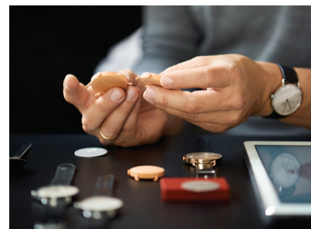
Am Anfang von jedem neuen Design stehen Skizzen und ein Moodboard. Später werden Muster und Prototypen hergestellt, zunächst aus Kunststoff und Messing, dann aus Stahl.